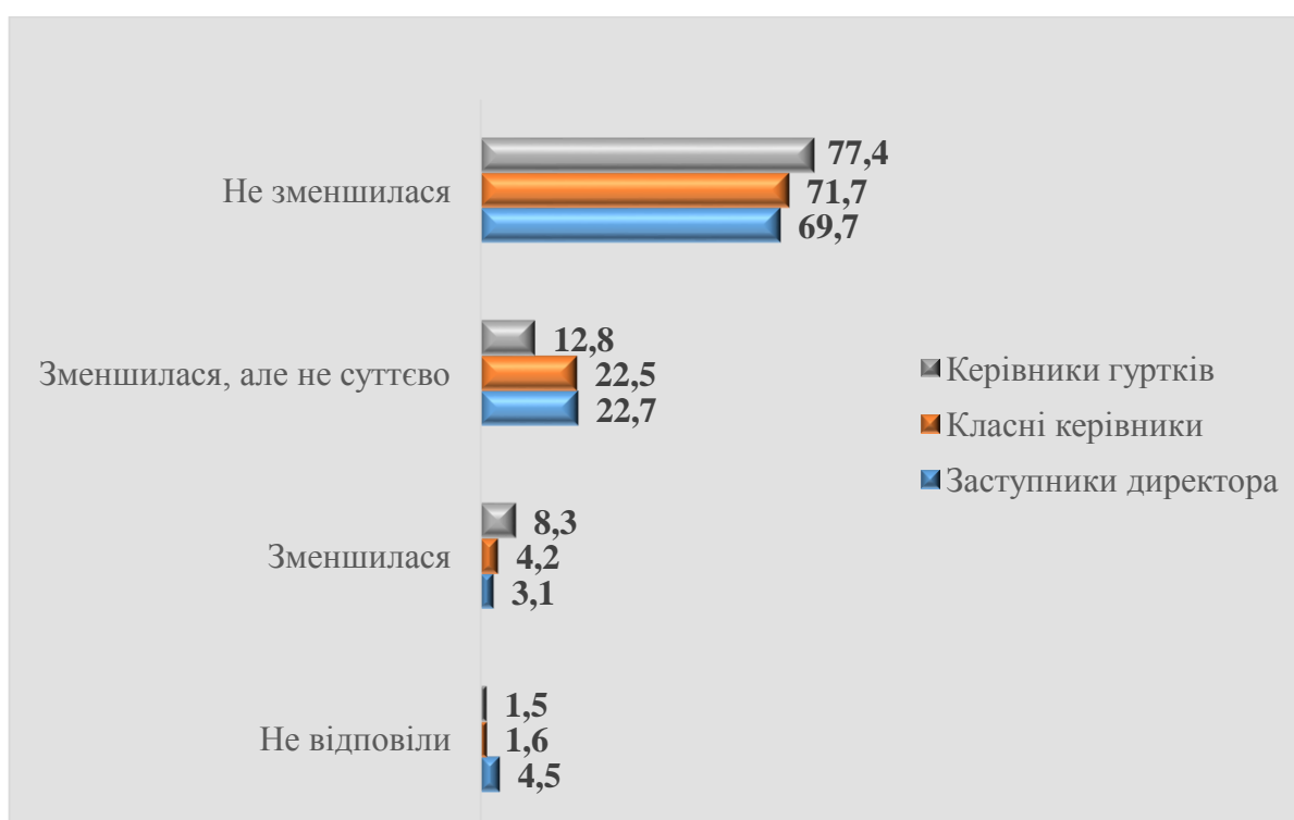
Діаграма 1. Розподіл відповідей респондентів на запитання: «Як змінилася кількість звітної документації в цьому навчальному році?», %