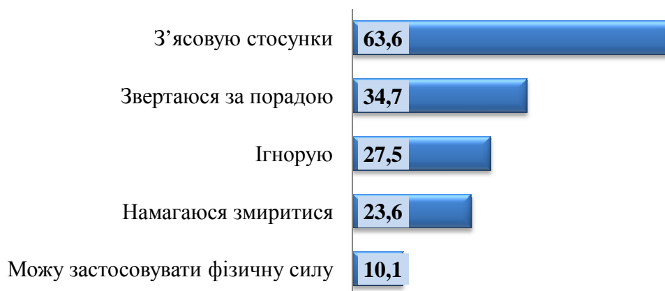
Діаграма 4. Розподіл відповідей учнів на запитання: «Якщо Ваша поведінка може порушувати спокій оточуючих, то чи завжди Ви будете зважати на їхні зауваження?», (у відсотках)