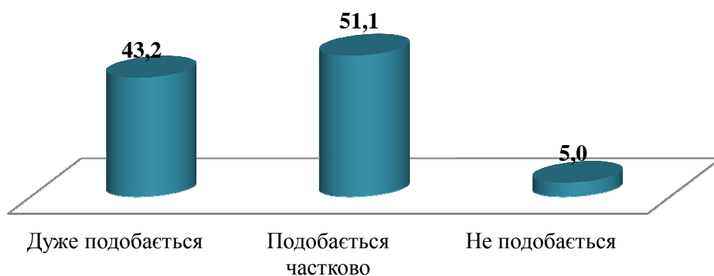
Діаграма 2. Розподіл відповідей учнів на запитання: «Як, на вашу думку, чи є навчання в училищі даремною тратою часу?», (у відсотках)