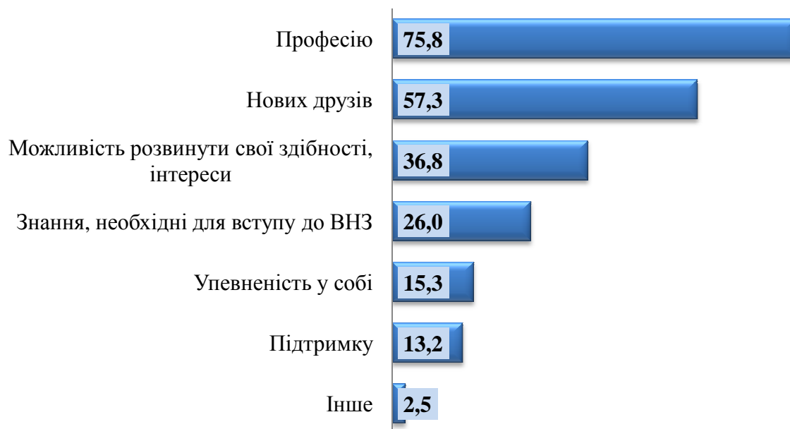
Діаграма 4. Розподіл відповідей учнів на запитання: «Чому саме ця професія була Вами обрана?», (у відсотках)