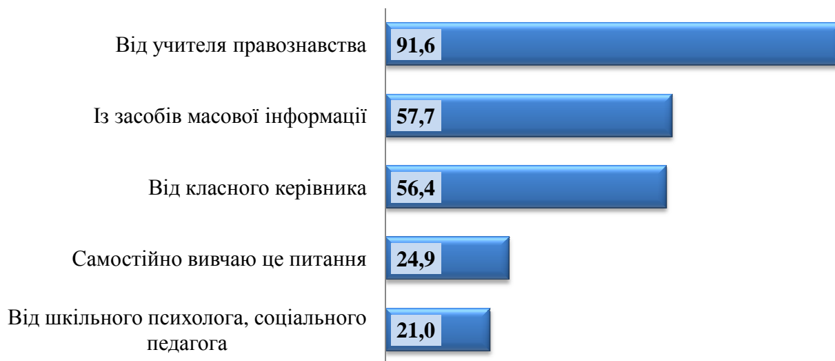
Діаграма 2. Розподіл відповідей учнів на запитання: «Де й від кого Ви дізналися про правила поведінки в громадських місцях?», (у відсотках)