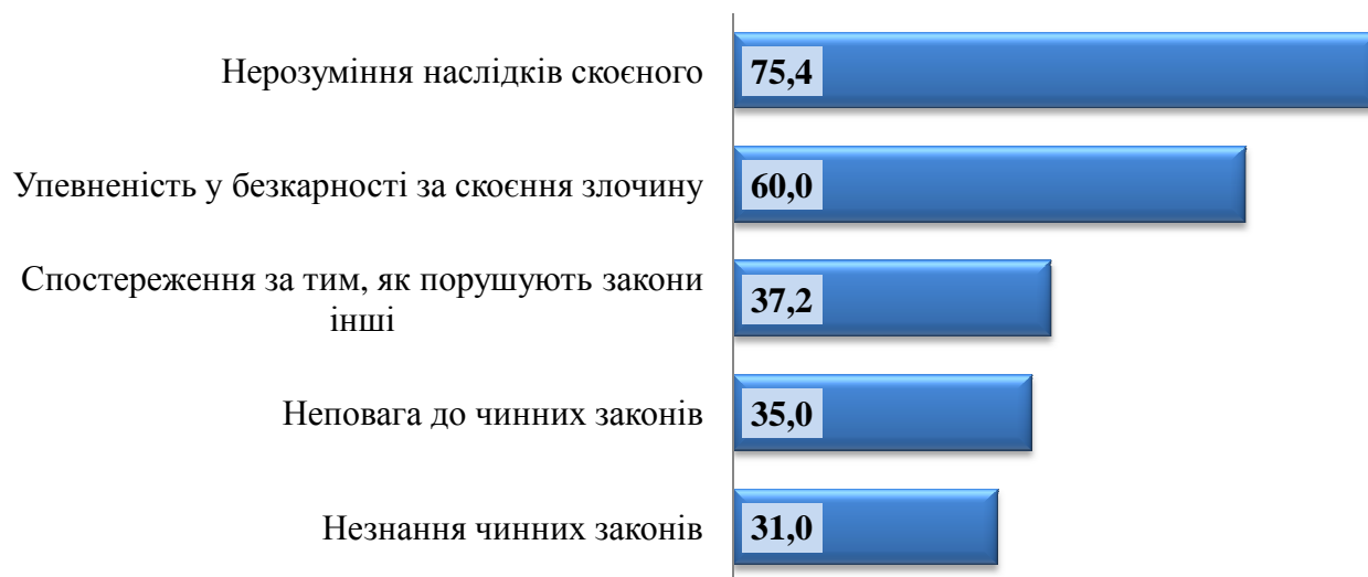
Діаграма 4. Розподіл відповідей респондентів на запитання: «Який, на Вашу думку, рівень морально-правової свідомості у більшості старшокласників?», (у відсотках)